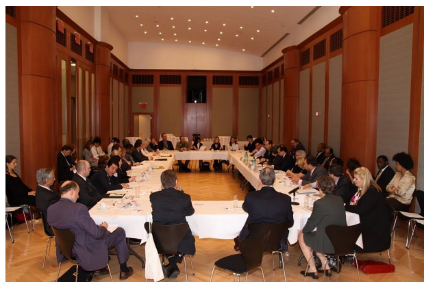
GPF/FES-Tagung in der deutschen UN-Vertretung in New York