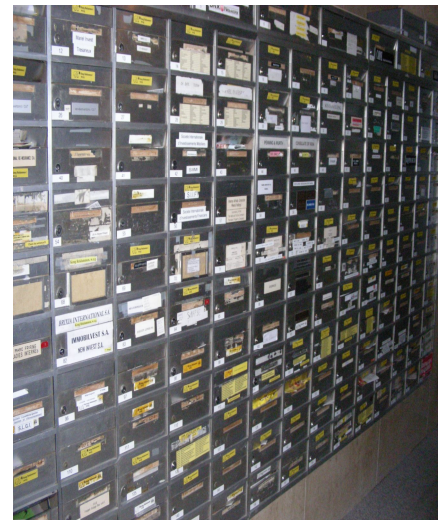
Briefkastenfirmen in der Steueroase Luxemburg