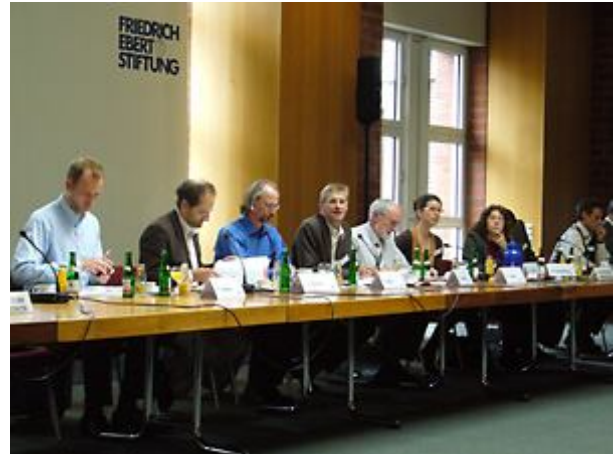
Podiumsteilnehmer beim Fachgespräch „Die UNO zwischen den G20-Gipfeln“

Am 13. Mai 2009 veranstalteten wir gemeinsam mit der Friedrich-Ebert-Stiftung und terre des hommes das Fachgespräch „Die UNO zwischen den G20-Gipfeln“. Es war ursprünglich als Auswertungsworkshop zur Doha-Konferenz über Entwicklungsfinanzierung 2008 geplant. Da das wichtigste Ergebnis der Doha-Konferenz die Entscheidung war, im Juni 2009 eine UN-Konferenz zur globalen Wirtschafts- und Finanzkrise durchzuführen, konzentrierte sich unsere Veranstaltung auf die Themen und den politischen Vorbereitungsprozess dieser Konferenz. Diskutiert wurden dabei auch die Empfehlungen der Stiglitz-Kommission zur Reform des internationalen Währungs- und Finanzsystems.