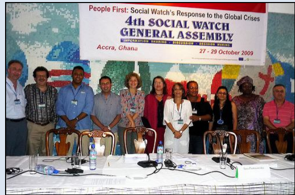
Der Koordinationsausschuss von Social Watch im Oktober 2009